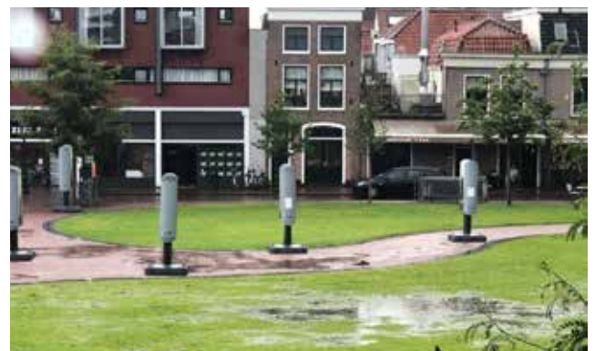
HET GARENMARKTPLEIN NA EVENEMENT

De herstelde sproei-installatie en het regenachtige weer hebben het gras inmiddels voor een deel opgeknapt. Stedelijk Beheer