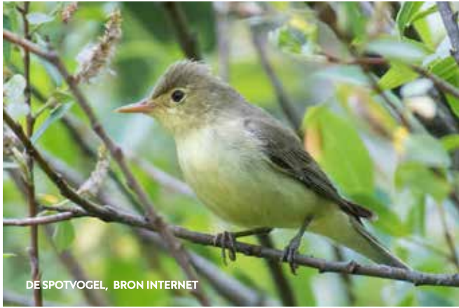
DE SPOTVOGEL, BRON INTERNET

Het lijkt erop dat de komst van de Orpheusspotvogel mogelijk is geworden door de opwarming van het klimaat. De achteruitgang van onze eigen spotvogel is minder makkelijk te verklaren, maar ook daarbij zou de klimaatverandering een rol kunnen spelen, want in Scandinavië en Rusland nemen de spotvogels juist toe.