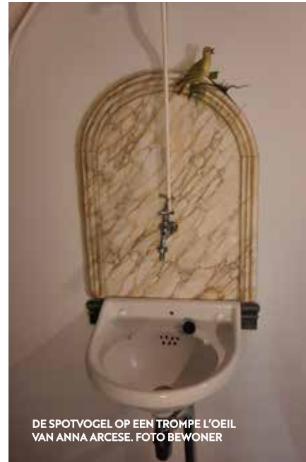
DE SPOTVOGEL OP EEN TROMPE L'OEIL VAN ANNA ARCESE.

Een halve eeuw geleden leefden de twee spotvogelsoorten geheel gescheiden van elkaar en was er geen enkel risico op hybridisatie. De Orpheusspotvogel broedde in Zuidwestelijk Europa. Deze soort verlaat zijn broedgebied aan het eind van de zomer om in West-Afrika te overwinteren. De trekroute loopt via de Straat van Gibraltar. De spotvogel broedde in West-Europa ten noorden van de Orpheusspotvogel, met een broedgebied dat zich uitstrekt tot ver naar het oosten van Azië. De spotvogel trekt via Turkije naar Zuidelijk Oost-Afrika. Er bestond vroeger dus geen enkel risico op vermenging van de beide soorten. Nu overlappen beide soorten elkaar in een deel van Frankrijk, in België en Nederland. We kunnen de komende jaren dus getuige zijn van interessante interacties tussen de beide soorten. Let dus goed op als u denkt een spotvogel te horen zingen. Is het nog altijd onze eigen vertrouwde spotvogel, met de imitaties van vogelsoorten die in de buurt broeden of hoort u al zangelementen van de Orpheusspotvogel. Mijn voorspelling is dat in Nederland de spotvogel langzaam zal worden vervangen door de Orpheusspotvogel, en dat de ons zo vertrouwde spotvogel zal worden verdrongen naar noordelijker gebieden waar het te koud is voor de Orpheusspotvogel.