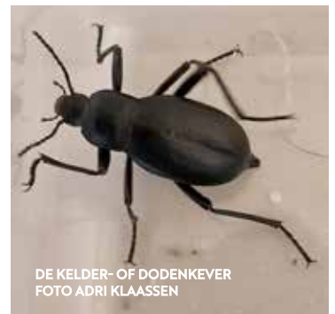
DE KELDER- OF DODENKEVER

Vanochtend in de wc, de ruimte niet de pot, zag ik er weer een: de blaps mortisaga oftewel kelderkever of dodenkever. Welnu, als je zo'n uit de kluiten gewassen kever ontwaart, zo gaat het verhaal, is dat een voorbode van een sterfgeval. In de herfst van mijn leven, is dat natuurlijk al gauw goed voorspeld, kan niet missen.