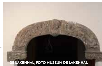
DE LAKENHAL