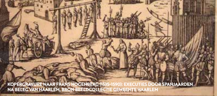
KOPERGRAVURE NAAR FRANS HOGENBERG (1535-1590): EXECUTIES DOOR SPANJAARDEN NA BELEG VAN HAARLEM