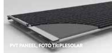
PVT PANEEL

PVT-panelen maken geen geluid. Dat is in onze dichtbevolkte binnenstad dus een mooie oplossing als een standaard warmtepomp te veel lawaai maakt. Bovendien zorgt de warmteoverdracht aan de achterzijde ervoor dat de panelen zelf minder heet worden, wat het rendement ten goede komt. Een voorbeeld van een leverancier van PVT-panelen is Triple Solar: www.triplesolar.eu .