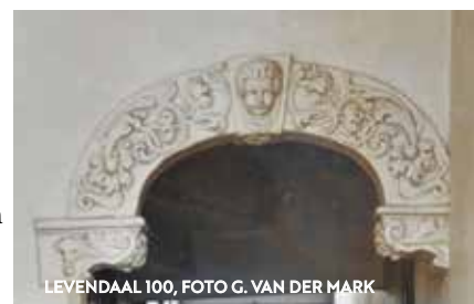
LEVENDAAL 100