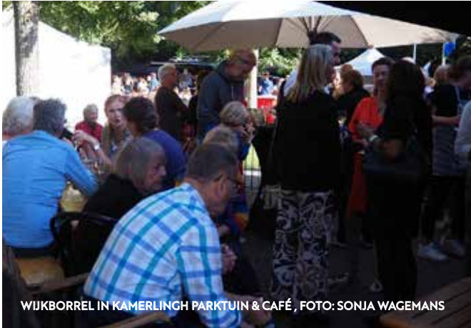
WIJKBORREL IN KAMERLINGH PARKTUIN & CAFÉ

De eerder aangekondigde wijkborrel zal plaatsvinden: