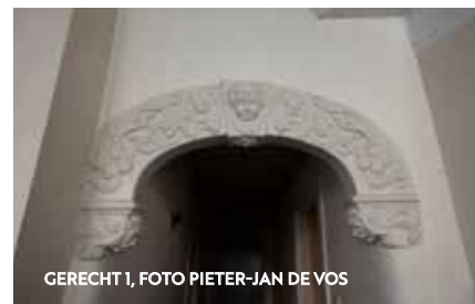
GERECHT 1

Door de ontdekking van de identieke toogjes van Gerecht 1 en de Stadstimmerwerf is verder gespeurd naar andere voorbeelden in Leiden. Zo dook een midden 20ste -eeuwse foto op van een toogje in het lang geleden gesloopte Levendaal 100. Ook dit toogje, uit circa 1660, is identiek aan die van Gerecht 1 en de Stadstimmerwerf, zodat we nu drie voorbeelden kennen. Een verde toogje werd ontdekt in museum De Lakenhal. In de collectiebeschrijving is sprake van een "Beschilderd gipsafgietsel van een stenen toog".