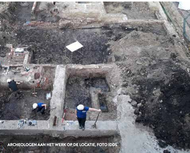
ARCHEOLOGEN AAN HET WERK OP DE LOCATIE

Hun onderzoek is net voor de zomer gepresenteerd. Uit overlevering wist men wel dat er rond het jaar 1000 in die buurt al sprake van bewoning moest zijn, maar bewijzen hiervoor waren er tot nog toe niet. Wel was het aannemelijk, want in de negende eeuw was er ten zuidoosten – rond de Burcht – al sprake van activiteiten. Tot deze vondst gold de ‘dijk’ langs de Rijn, de Breestraat, als oudste 14de-eeuwse bewoning in Leiden; C14-koolstofdatering aan de hand van houten binten heeft dat aangetoond. Nu blijkt dus dat er veel eerder werd gewoond en wel op de noordoever van de Rijn, in het huidige Maredorp. Men vond er zeven rijen houten palen. Het is zeker dat die voor en door mensen zijn geplaatst, vermoedelijk om fuiken of boten aan te bevestigen. Het gaat alleen om de onderste delen., de bovenkant van het hout is niet bewaard gebleven, dus dat biedt helaas geen uitsluitsel over de functie.