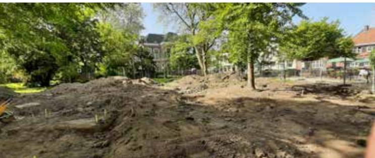
BOOMWORTELONDERZOEK VAN DER WERFPARK

Om de boomwortels niet te beschadigen heeft de aannemer onderzocht hoe diep gegraven kan worden. Er zijn proefsleuven gegraven om de wortels op te zoeken en met piketpaaltjes werd aangegeven hoe diep de grond bewerkt kon worden. Daarna is de bodem aangevuld met zand en teelaarde en zijn in het midden van het park ondergrondse afwateringsslangen ingegraven. Verder is er een beregeningsinstallatie aangebracht – de beregening is zo afgesteld dat er ook onder de bomen beregend kan worden. Vervolgens is rondom de gazons een hekwerk geplaatst, zodat niemand, en zeker geen honden, het terrein op kan. In het najaar wordt beoordeeld of het gras is aangeslagen en dan zal ook worden gekeken waar schaduwplanten kunnen komen. Vreemd genoeg was men van plan om het park op 3 oktober even open te stellen voor de koraalzing bij het Van der Werf-monument, maar gelukkig hield wethouder North dat tegen.