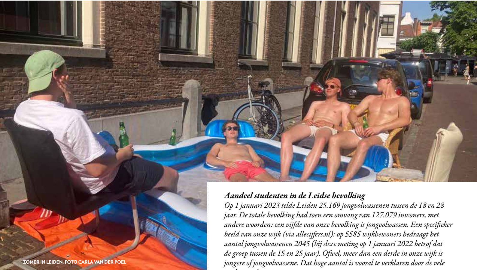
ZOMER IN LEIDEN