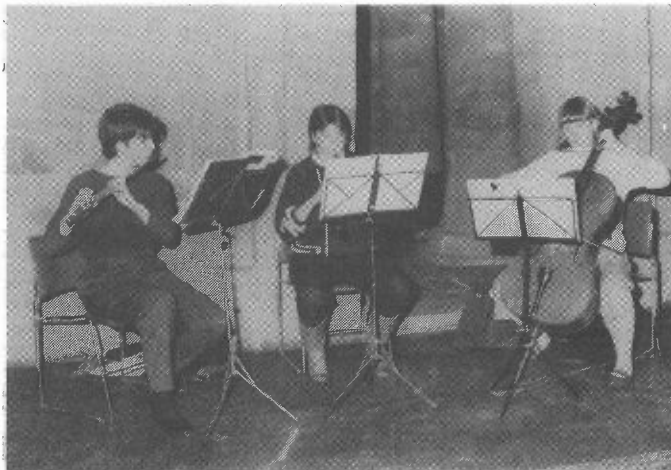
Collegium Musicum in Taffeh-zaal