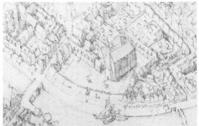
FALYDE BEGIJNHOF, Detail van de kaart van Pieter Bast uit 1600

De invloed van de wijkvereniging op het "Structuurplan voor de binnenstad" en op het Bestemmingsplan was groot en werd ook mogelijk gemaakt, met alle redelijkheid van onze kant en van overheidszijde. Het gevoel "Inspraak" te hebben maakten de uren en dagen die bestuurders van de wijkvereniging in die plannen staken, de moeite waard en gaf redelijk voldoening, al was niet alles wat men inbracht bespreekbaar of haalbaar, maar toch! Terugkomend op het Begijnhof, de voldoening dat deze pandjes behouden konden blijven, is groot, al is natuurlijk het doorzettingsvermogen van de voormalige krakers het belangrijkste. Een kleine kern van hen heeft het wonder verricht om met zeer bescheiden middelen en met hulp van velen dit te bereiken: gerestaureerde pandjes van het Falyde Begijnhof, een restant van een groot complex.