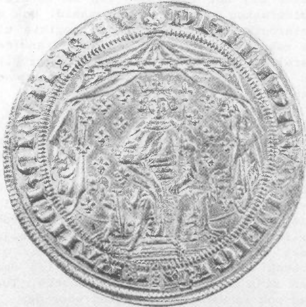
gouden paviljoen, Frankrijk Philipus VI (1328-1350) O 31 mm

In een elftal vitrines wordt een veelzijdig beeld gegeven van de vaak zeldzame munten. Uit Frankrijk worden gouden paviljoenen en schilden getoond en uiteraard zijn de florentijnse guldens in de vitrine te bewonderen. Een grote hoeveelheid pruisische penningen en zilvergeld uit de mediterane wereld hebben in de tentoonstelling een plaats gekregen. Het publiek kan de finaciele toestand van de graaf exact volgen op de balans die in iedere vitrine te vinden is.