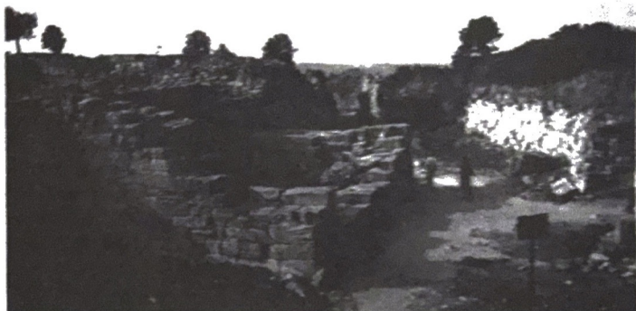
de stadsmuur van Troje VI, gezien vanaf het zuid-oosten, verwoest rond 1200 v. Chr.