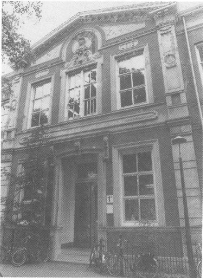
De voormalige Meisjes HBS op de Garenmarkt is een gemeentelijk monument