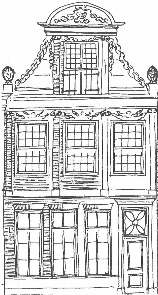
Een van de te restaureren panden aan de Langbrug