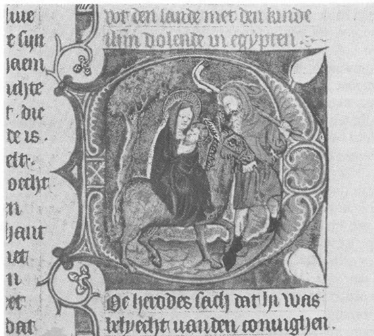
De vlucht naar Egypte, Miniatuur in "de Tafel der Kersten Ghelove", British Museum, Londen.