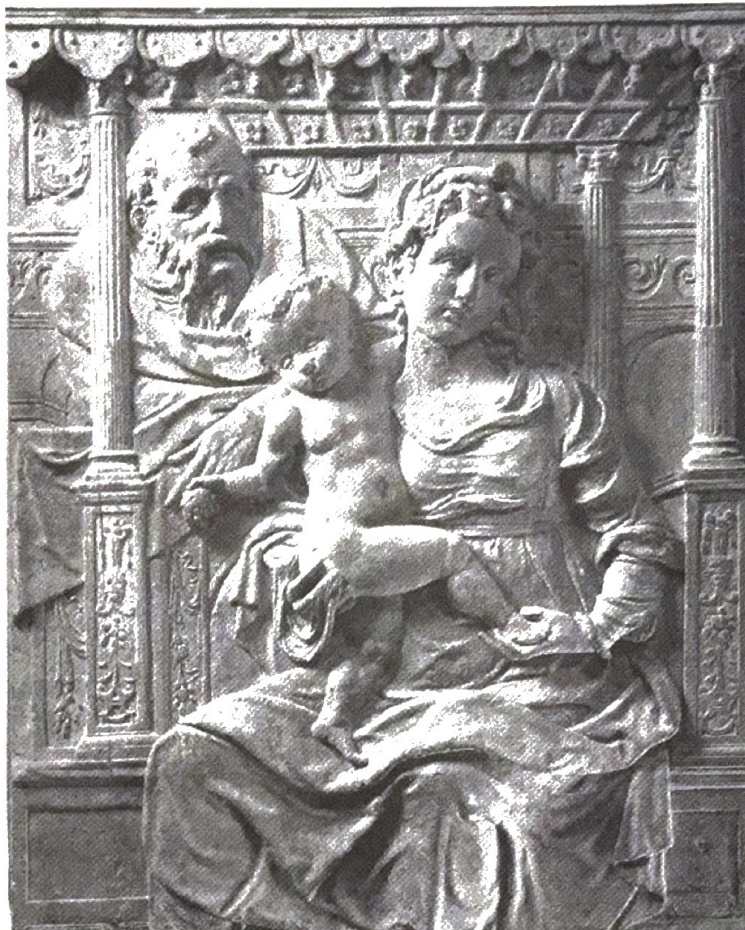
Heilige Familie kalksteen, 75 x 60 cm, Rijksmuseum het Catharijneconvent, Utrecht