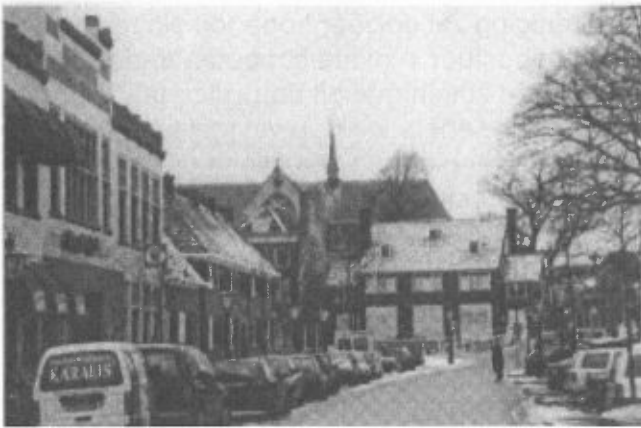
Oude situatie