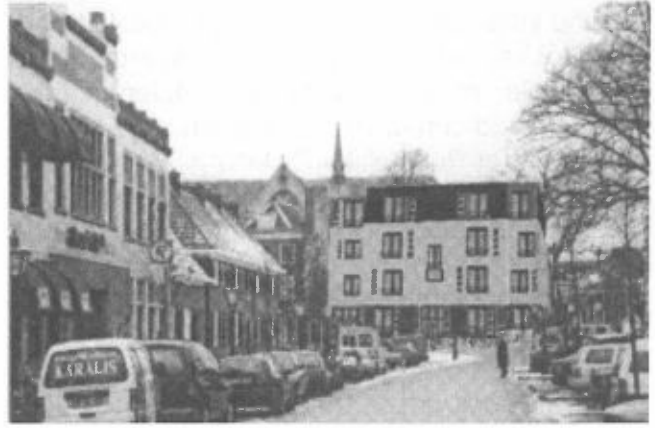
Nieuw situatie, montage Wim Kruijshaar