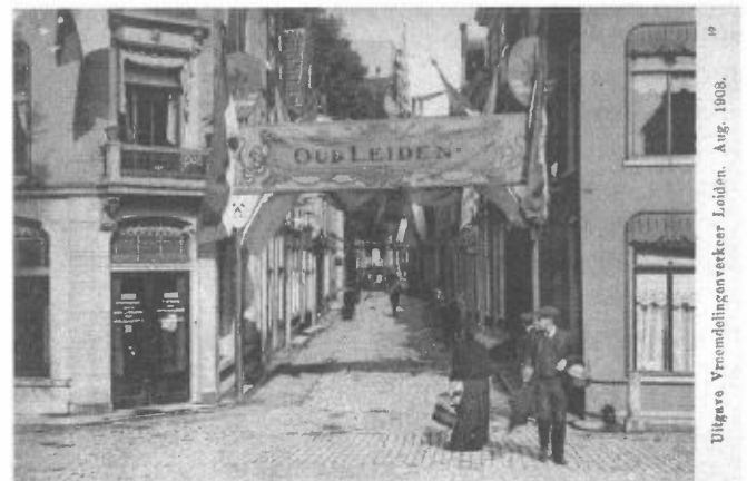
Het Pieterskerkplein en omliggende stegen werden in het begin van deze eeuw enkele keren gebruikt om er pseudo-Oud-Hollandse geveltjes en dergelijke neer te zetten in het kader van tentoonstellingen, lustrumvieringen e.d. Hier is aan het begin bij het Rapenburg een soort poort door de vereniging Oud Leiden aangebracht

Ook zonder Klokhuis zou de steeg er zijn naam tot op de huidige dag aan blijven ontlennen. Dat wil niet zeggen dat dat altijd zonder slag of stoot ging. Rond 1900 werd het een soort rage om de