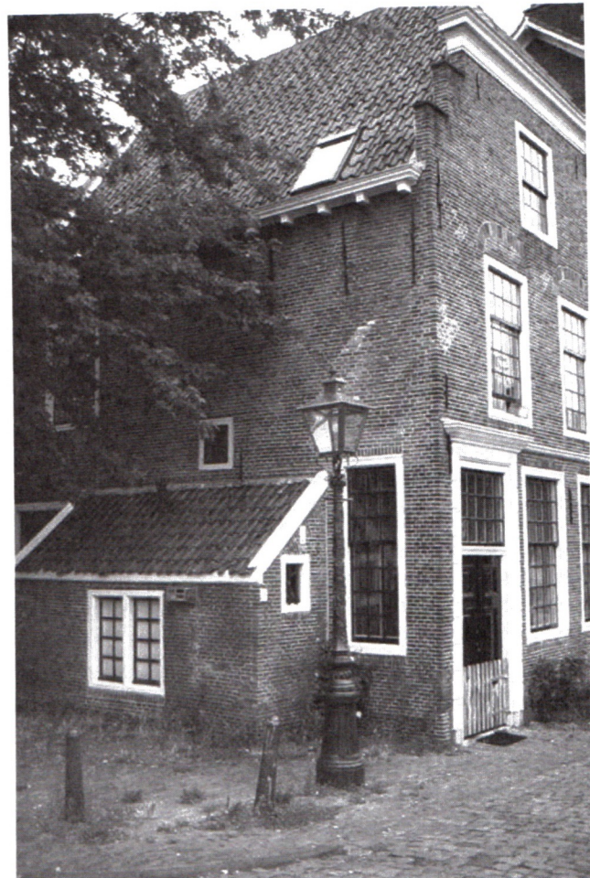
Pothuisje in Leiden. Foto uit Leiden met een luchtje .

Een pothuisje is een laag aanbouwsel aan een huis, doorgaans met een hellend dak. Hoewel de naam waarschijnlijk afgeleid is van het gebruik als opbergplaats voor pottenbakkerswaar of keukengerie, werden veel Leidse pothuisjes door een andere beroepsgroep gebruikt: de schoenlappers. Schoenlappers repareerden schoeisel van voorbijgangers. Zij werkten overigens niet alleen vanuit deze pothuisjes, maar ook in losse bouwsels op bepaalde plaatsen in de stad, bijvoorbeeld bij bruggen. Maar zij deden méér dan schoenen lappen.