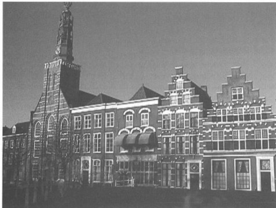
De Lodewijkkerk aan de Steenschuur