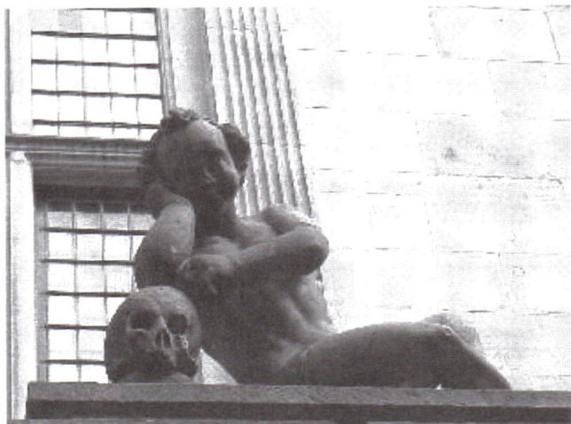
De Eeuwigheid in betere tijden.