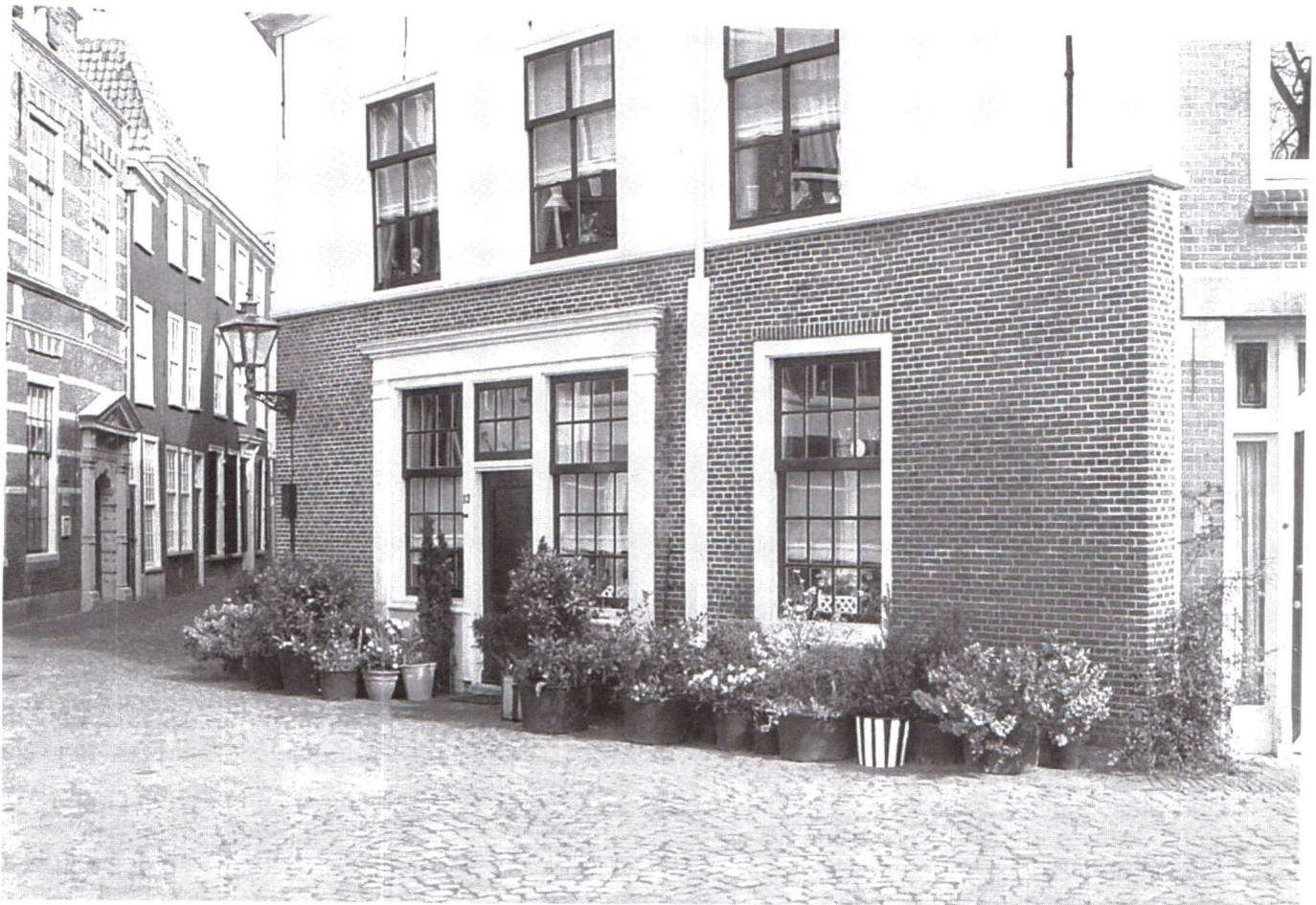
Groen in de wijk.

Vaak waren concrete klachten de aanleiding om ergens een schoenlapper te installeren. Een mooi voorbeeld is het pothuisje aan het huis op de hoek van de Oude Varkenmarkt en Groenhazengracht. In 1617 klaagden buurtbewoners dat er voortdurend afval werd neergegooid bij de Doelenbrug. Zij waren de vervuiling van de buurt beu. Daarop besloten die vanden gerechte (het dagelijks bestuur van de stad) het pothuisje te laten bouwen en er een schoenlapper neer te zetten. In 1751 werd het pothuisje nog op stadskosten gerepareerd, dus toen werd het nog hiervoor gebruikt.