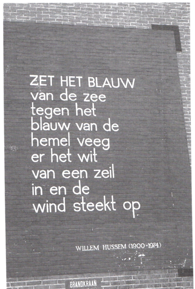
Gedicht op de muur.

Ook Leiden laat zich niet onbetuigd. In 1996 heeft het Centrum Beeldende Kunst in samenwerking met de afdeling Stedenbouw van de gemeente het plan opgevat om kunstprojecten voor de openbare ruimte te initiëren. Mij werd gevraagd om een masterplan beeldende kunst voor de binnenstad op te stellen. Dat heeft geresulteerd in het plan 'Kietelen, niet bijten..?', waarvoor de