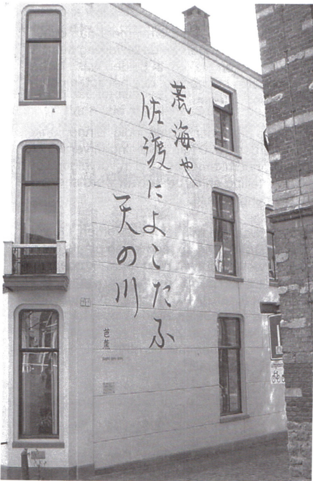
Gedicht op de muur.

Namens de Werkgroep Referendum Aalmarkt Mark Meelker