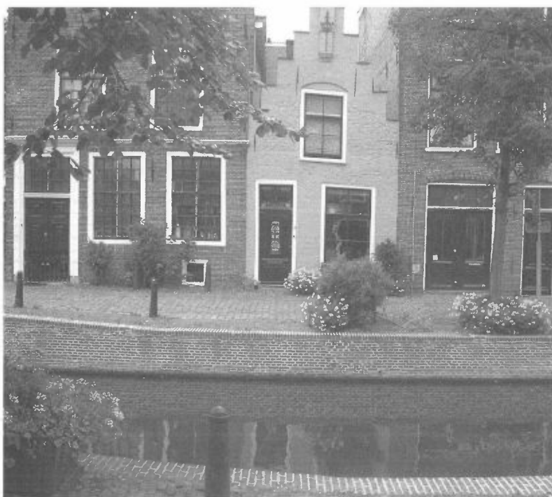
Klein monument aan de Groenhazengracht

Binnen de singels zijn inmiddels veel huiseigenaren lid van het anti-klad project. Dat betekent dat zij eenmalig de helft van de schoonmaken kosten voor hun rekening nemen en elke bekladding daarna kosteloos kunnen laten weghalen. Huiseigenaren van in het oog springende panden waar niets aan wordt gedaan, krijgen het dringende aanbod alsnog lid te worden. Zijn zij geen lid en maakt de dienst hun gevel schoon, dan worden de totale kosten op hen verhaald. Dit vooruitzicht doet veel huiseigenaren besluiten toch deel te nemen aan het project.