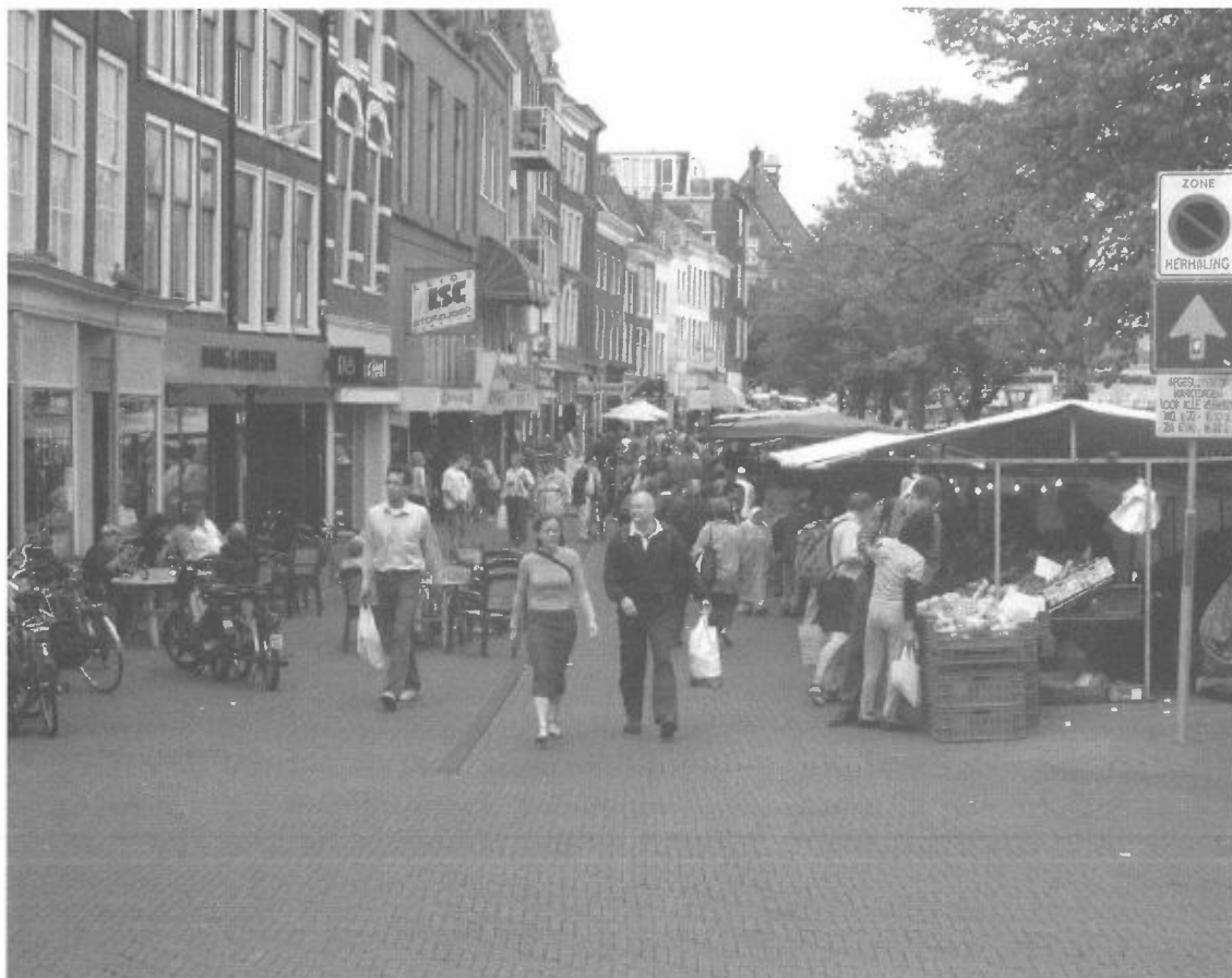
Zaterdagmarkt in de wijk

In het Sijthoffpand op de Doezestraat zal het kantoor komen van een offshore uitzendbureau, een bijzonder bedrijf voor de Leidse binnenstad. De komst gaat met flinke verbouwingen gepaard.