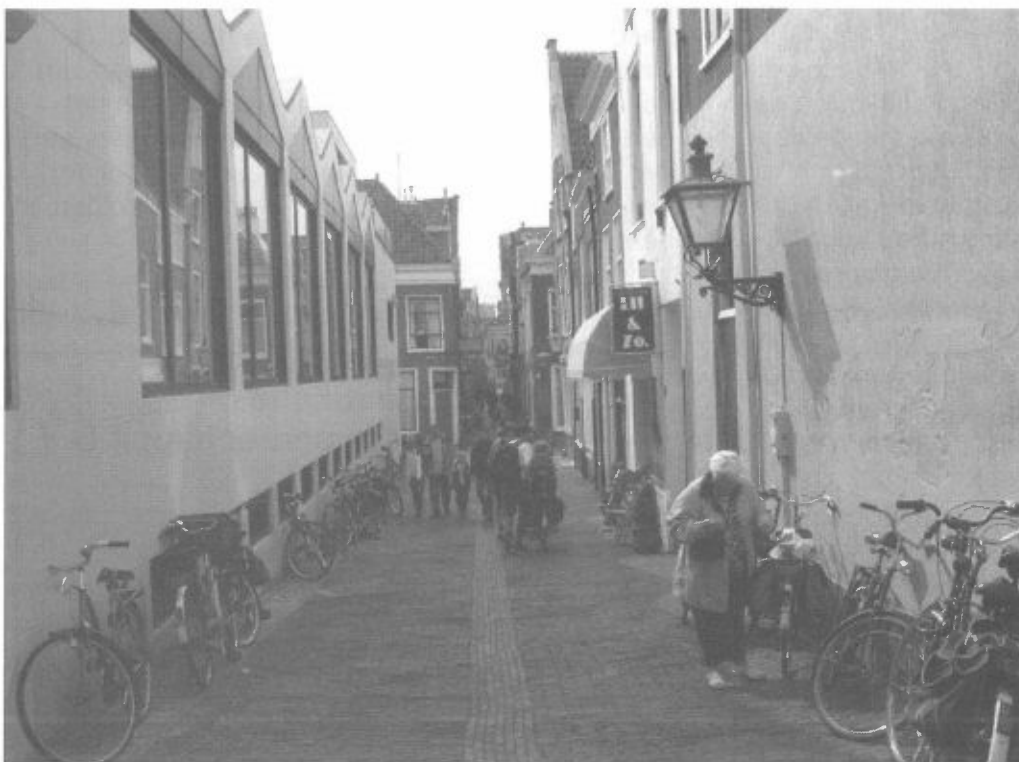
Diefsteeg: woonklimaat aangetast?

Als buurt zullen we de vinger aan de pols houden in de gedachte dat de vergunning slechts voor een jaar is verleend onder nogal strikte voorwaarden.