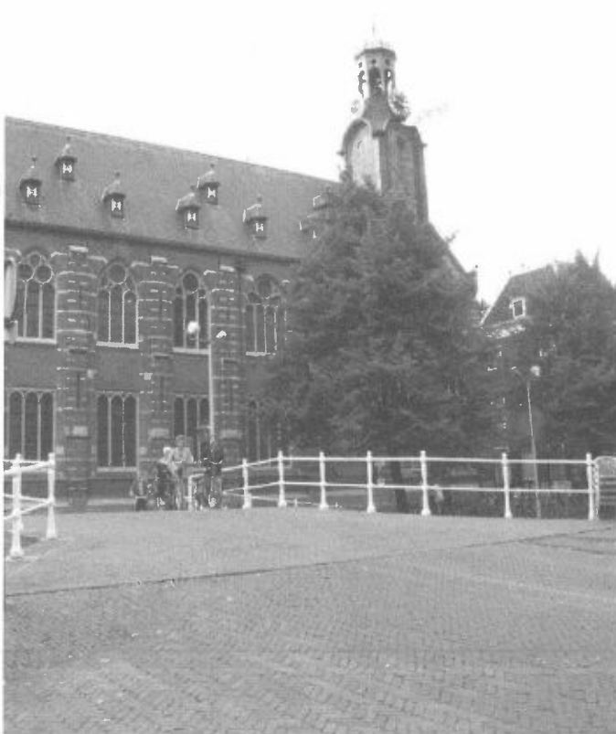
Academiegebouw aan het Rapenburg