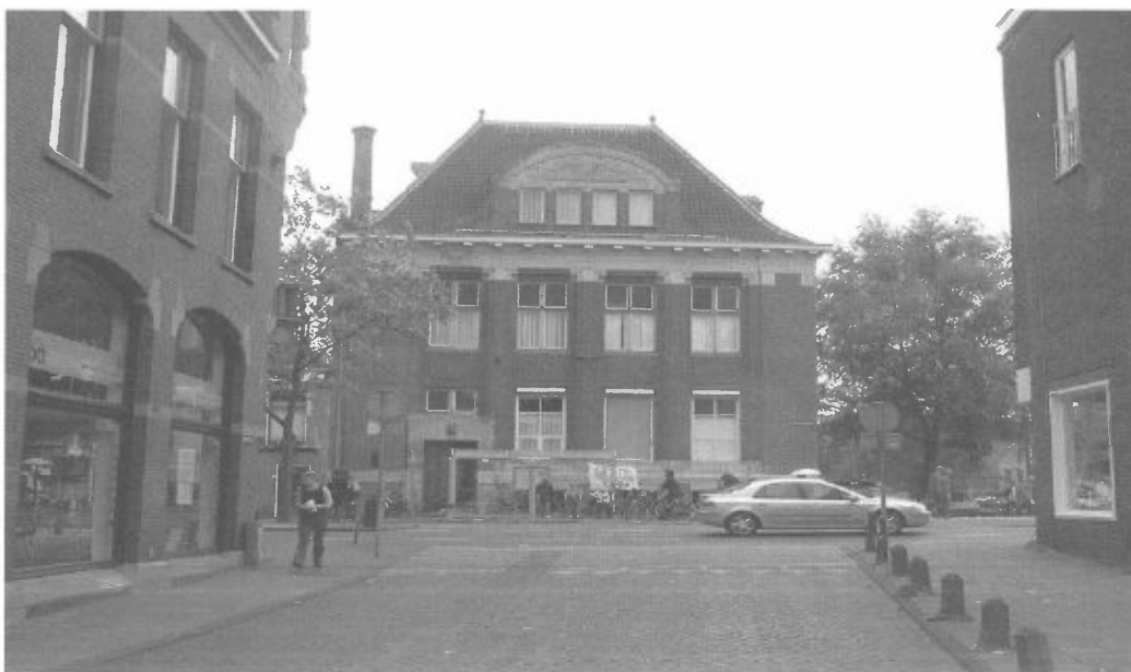
Oud bankgebouw op het Kort Rapenburg

In de vorige wijkkrant kon u al lezen welke mogelijkheden er zijn om autorijdende gasten in Leiden te ontvangen. Nu zijn er nog meer mogelijkheden: vanaf het Haagwegterrein kan men tegenwoordig ook met een gratis "blauwe fiets" de stad in. En er zijn zelfs enkele rollators voor wie een extra steuntje nodig heeft op weg naar het centrum.