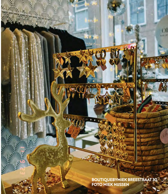
BOUTIQUEBYMIEK BREESTRAAT 30

heeft gekregen. Ze kochten bij haar maar ze wilden graag naar een fysieke winkel om kleding te passen, en ook gewoon om er te zijn. Als ze iets kopen wordt er ter plekke een filmpje gemaakt om te laten zien dat ze in de winkel waren. Als je naar deze boetiek bent geweest tel je mee. Het prettige is dat Mieke door haar klanten in levende lijve te spreken nog beter ontdekt wat ze zoeken.