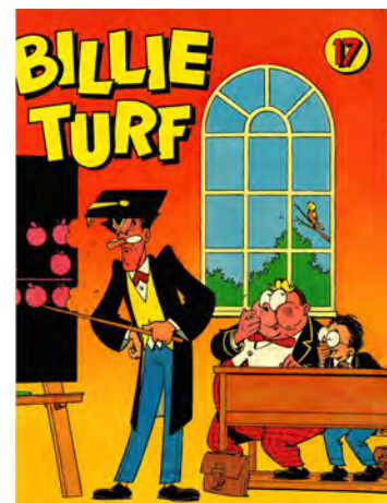
BILLY TURF HET DIKSTE STUDENTJE TER WERELD

Waarom noemen we iemand met rood haar graag 'rooie' of 'stoplicht' of 'vuurtoren'? En waarom scheppen we er een zeker genoeg in om een al te dik persoon te betitelen met grove termen als 'dikbil', 'hangbuikzwijn' of gewoon 'vetlap'? Dat komt omdat we bang zijn. Bang dat we zelf ooit ook eens een lichamelijke afwijking zullen krijgen. Of dat onze kinderen met een handicap geboren zullen worden. Daarom spreken we die bezweringsformule uit. Met 'hangbuikzwijn' geven we te kennen dat wij gelukkig anders zijn en dat wij gelukkig niet zijn voorzien van zo'n al te stevig ontwikkeld aanhangsel en dat wij verwachten dat dat ook nooit zal gebeuren. Die neiging tot schelden is een algemeen menselijke, zij het niet al te positieve eigenschap, bedoeld om het boze af te weren.