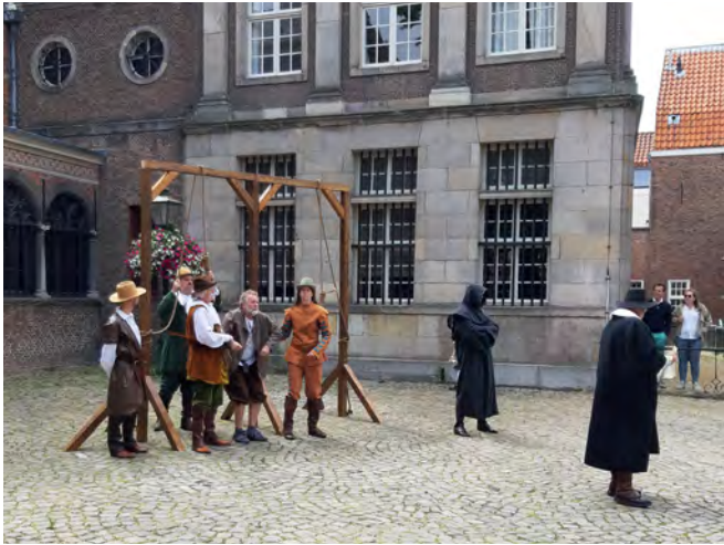
REMBRANDTDAGEN 2015

evenementen als vanzelfsprekend plaats in de binnenstad, maar de geluidsnormen zijn nog steeds erg hoog. Te hoog eigenlijk voor monumenten zonder geïsoleerde gevels en ramen. Rond 2019 heb ik nog meegedacht met het bestuur over een reactie op de locatieprofielen voor evenementen die de gemeente had ontwikkeld. We hadden een inhoudelijk goed onderbouwde reactie, maar die is helaas zonder meer opzijgeschoven.