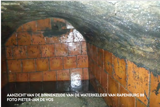
AANZICHT VAN DE BINNENZIJDE VAN DE WATERKELDER VAN RAPENBURG 88

In deze bijdrage komt de waterkelder aan de orde, een kenmerkend voorbeeld van een eeuwenoud nuttig fenomeen in de Leidse binnenstad. Heeft u vergelijkbare vondsten gedaan? Deel ze met Erfgoed Leiden en Omstreken, voor een completer beeld van deze unieke structuren en de rol die ze kunnen spelen in de hedendaagse duurzaamheidsuitdagingen. Samen geven we dan betekenis aan het verleden voor een meer duurzame toekomst.