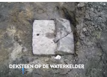
DEKSTEEEN OP DE WATERKELDER