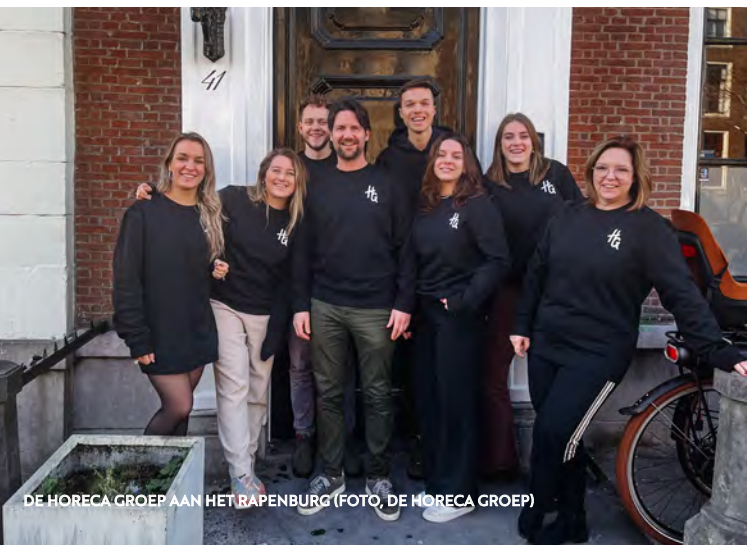
DE HORECA GROEP AAN HET RAPENBURG