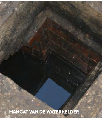
MANGAT VAN DE WATERKELDER