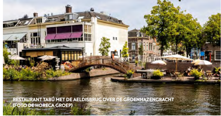
RESTAURANT TABÚ MET DE AELDISBRUG OVER DE GROENHAZENGRACHT