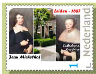
POSTZEGEL MET HET JEAN MICHELHOF IN DE PIETERSKERKSTRAAT