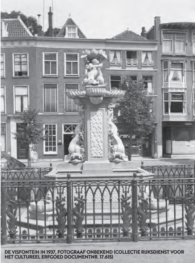
DE VISFONTEIN IN 1937

Nog een aardig detail: aan de onderkant van het hek: tussen de dwarsspijlen is een doorlopende serie kleine decoraties te zien. Dit betreft klassieke motieven in de architectuur. Aan de onderkant zien we schelpvormen, symbool voor de zee, en erboven palmetten (gestileerd palmbblad), die naar het land verwijzen. Momenteel is de fontein weer ingepakt in zijn 'winterjas' om vorstschade te voorkomen, maar het hek staat daar los van. •