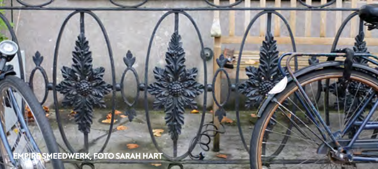
EMPIRE SMEEDWERK

steden en musea en natuurlijk de wijngoederen. We sliepen vaak op die wijnadressen, een vroege vorm van het agriturismo dat je nu overal hebt. Het mondde uit in de verhuur van vakantiehuizen, een boek over Toscane en toenemende verkoop, vooral natuurlijk van Italiaanse wijnen. Voor ik er erg in had was ik daar specialist in.”