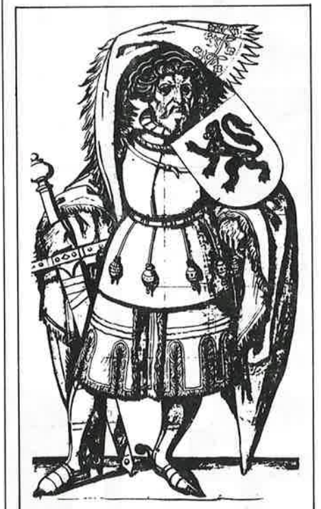
Dirk VI, XII Graaf van Holland van 1121-1157

De respectievelijke Graven van het Hollandse Huis zullen op hun vele lange reizen menig slot of burcht gezien hebben, waar een kapel aan of bij stond. Petronella van Saksen, echtgenote van Floris II de Vette en moeder van Dirk VI, overleden op 23-5-1144, stichtte de Abdij van Rijsenburg en de eerst begraven daar, het is dus niet onlogisch dat zij de hand gehad heeft in de stichting van de kapel. De stichting(?) inwijding van een kapel op 11 september 1121 zal