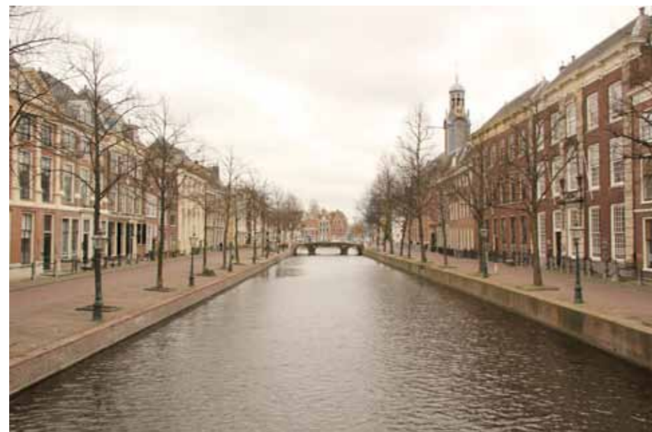
Een leeg Rapenburg zonder auto's en fietsen bij filmopnamen in 2017

Een eerste risicoanalyse lijkt erop te wijzen