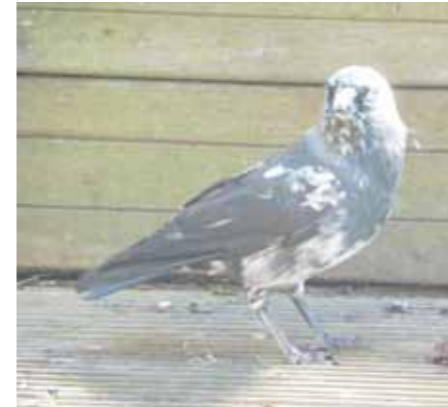
De kauw Spikkel in het Neeltje van Zuytbrouckhof