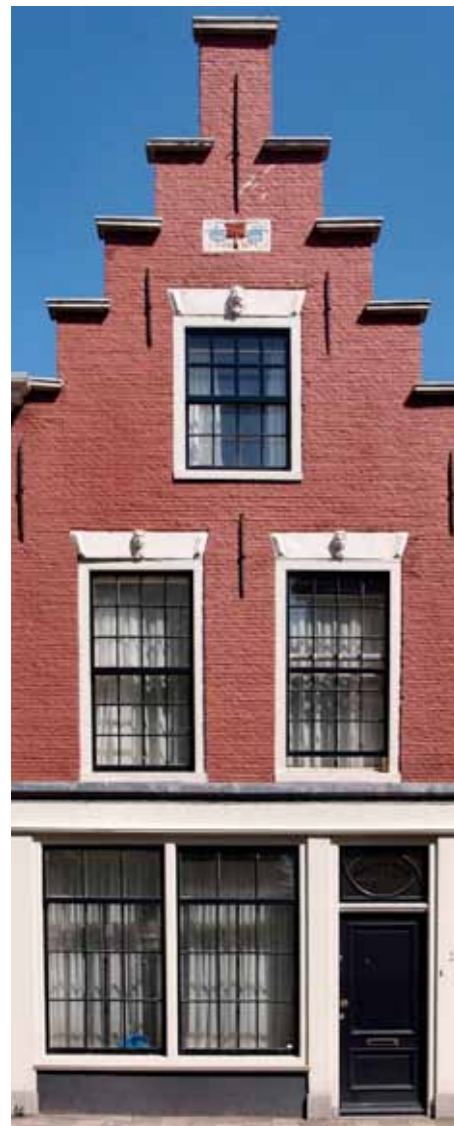
Noordeinde 24 met gevelsteen waarop roskam en hanenkammen

omgetoverd in een plantentuin en de buurt aangestoken. Ze hadden er de Steenbreektrofee mee gewonnen, een jaarlijkse onderscheiding voor initiatieven tegen verstening, en een Groene Duim van het Instituut voor Natuureducatie en