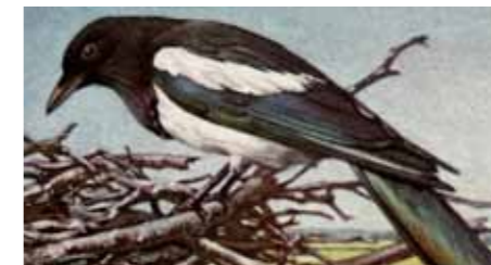
Ekster uit het Verkadealbum De boerderij (1936)

Hij leefde een jaar of drie zo, in innige vriendschap met mij, z'n baasje. Op een gegeven morgen lag hij dood in zijn kamertje. Ja, kamertje, hij was te goed voor een kooi. Hij moest ruimte hebben. Ik heb hem in de tuin begraven in een mooi teakhouten kistje. Edgar, ik zal hem nooit vergeten.