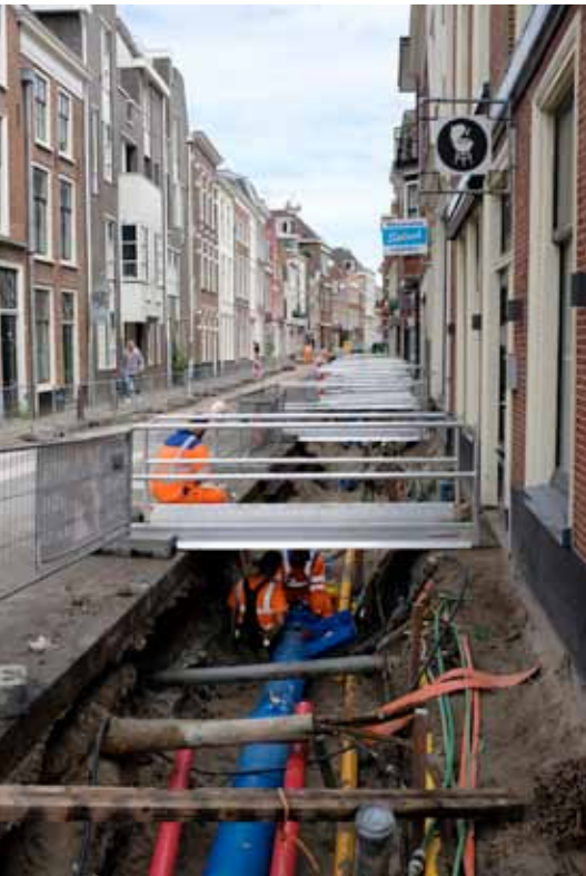
Het Noordeinde in juni