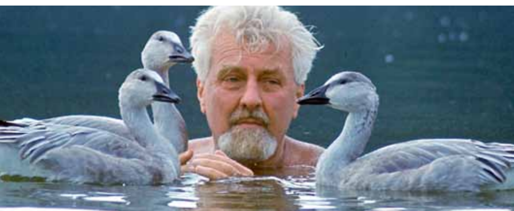
Konrad Lorenz (1903-1989)

In 1909 is de grauwe gans in Nederland als broedvogel uitgestorven. Het laatste paar broedde in Friesland. De oorzaken waren het ontginnen van rietlanden en vooral de jacht op wilde ganzen. Het duurde tot de jaren vijftig van de vorige eeuw voordat er weer grauwe ganzen in Nederland broedden, maar dat waren incidentele gevallen. Pas toen er in het begin van de jaren zestig bij de drooglegging van Oostelijk Flevoland uitgebreide rietlanden ontstonden gingen de grauwe ganzen weer regelmatig in ons land broeden, zij het in kleine aantallen. Deze winter zijn ze in de Hortus en de Witte Singel gesignaleerd.