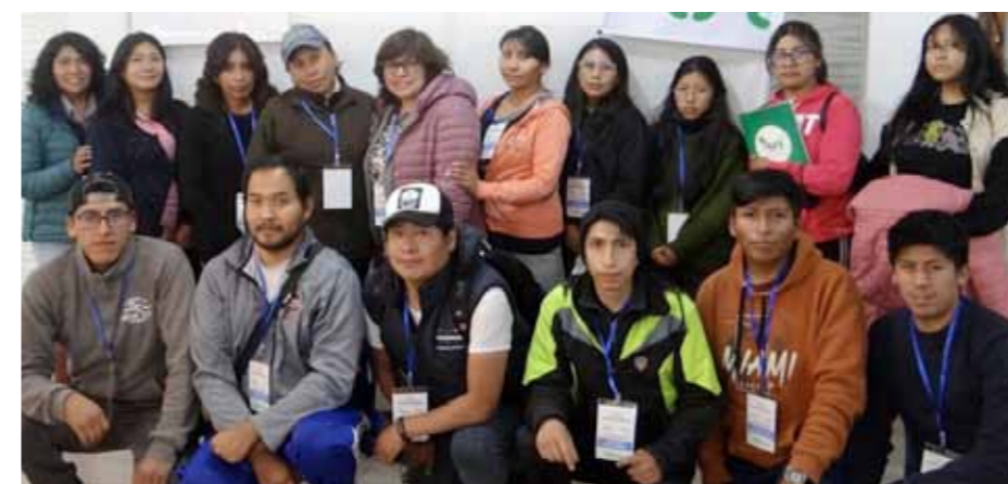
Vrouwen uit het project in Colombia met mensen van de plaatselijke, begeleidende organisatie

Met name de economieën in Afrika groeien snel, is ondersteuning daar nog lang nodig? 'In een aantal landen is er zeker groei', zegt Joep, 'maar die komt zeker niet iedereen ten goede. De mensen die buiten de boot vallen kunnen worden geholpen door DEAL.'