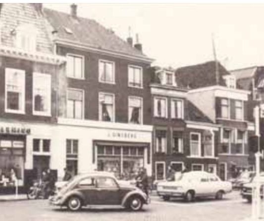
Boekhandel J. Ginsberg op het Kort Rapenburg jaren '60