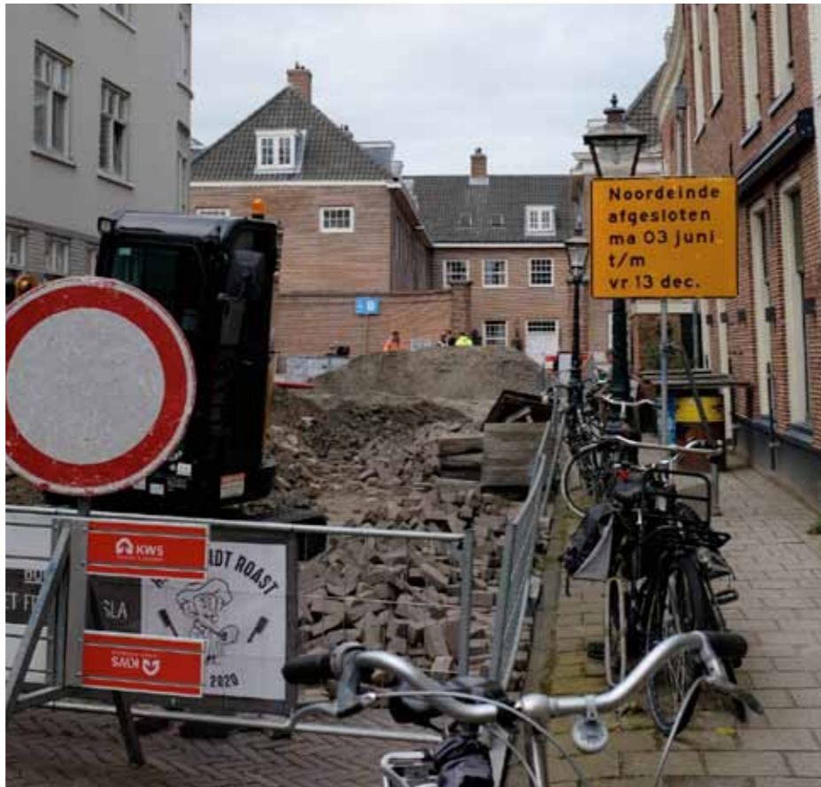
De Rembrandtstraat in juni

Jermoumi: 'Bij de opstelling van de Handreiking hebben we ons als gemeente open opgesteld. Onze rol is sturend. Wij zitten aan de voorkant. We verlenen bij woningbouwprojecten de opdracht en stellen samen met de gemeenteraad de kaders vast, maar de verantwoordelijkheid voor de wijze waarop de participatie is geregeld, ligt bij de projectontwikkelaar. Die moet dat goed oppakken en in zijn participatieplan aangeven hoe dat is geregeld. Wij kijken mee en toetsen. We kunnen bijvoorbeeld tegen een ontwikkelaar zeggen: 'Je hebt nu wel gezegd dat je dit of dat zou doen, maar wij zien daar in de praktijk niets van terug.' Het risico dat mensen afhaken is daarmee natuurlijk niet weg. Sommige gebieden zijn zo complex en er spelen zoveel factoren mee dat ze ook voor experts vaak moeilijk zijn te doorgronden. Ik begrijp heel goed dat je dat als leek niet overziet en je afvraagt wat er met je inbreng is gedaan. We moeten het proces van participatie dan ook ambtelijk goed begeleiden. Aangeven waarom iets niet kan en dat blijven uitleggen. De Handreiking is daar het handvat voor.'