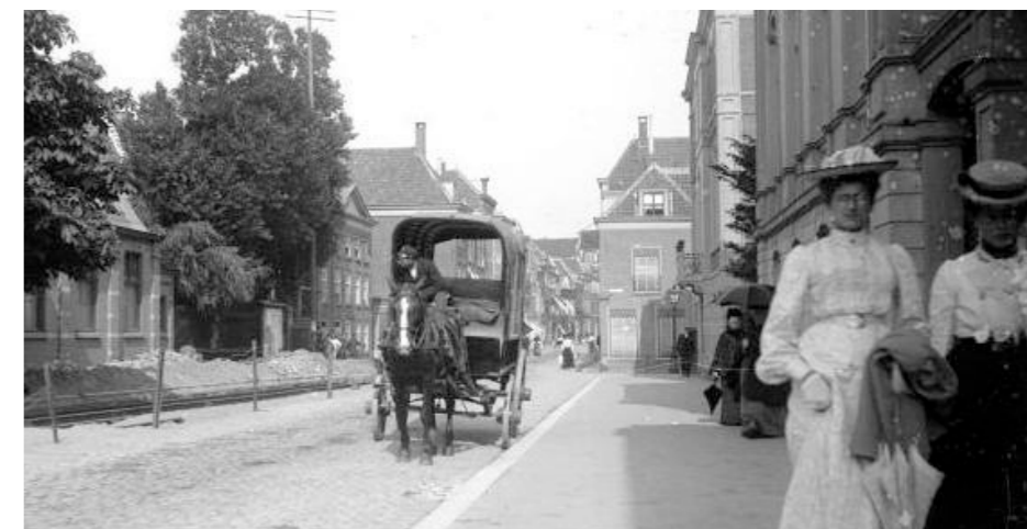
Noordeinde begin 20e eeuw