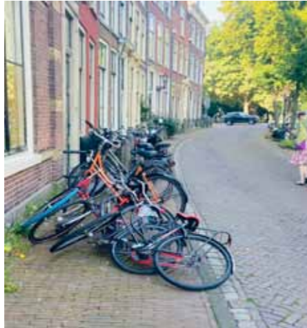
De Steenschuur

Vier van de tien vragen betroffen de overlast van willekeurig en overmatig fietsparkeren, zeker als de fietsen de doorgang belemmeren op stoepen of in stegen. Het ontbreekt op dit punt aan voldoende handhaving. De leden van de wijkvereniging zouden graag zien dat het 'fiets fout = fiets weg'-beleid dat geldt rond het station ook van toepassing wordt op de binnenstad. Een deel van de straks weggesaneerde autoparkeerplaatsen kan worden omgevormd tot fietsparkeerplaatsjes.