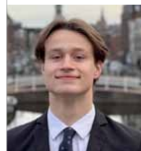
Joep van der Kruijk foto DEAL

De winnaars van het afgelopen jaar gaan investeren in een eigen lijn duurzame kleding en duurzaam geproduceerde shampoo.