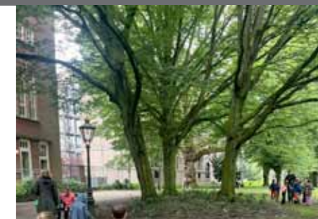
Leerlingen van de Haanstra helpen bij de schoonmaak van het park

Werfparkvrienden aan de slag In juni zijn de Werfparkvrienden aan de slag gegaan in het park. Ze hebben de aanplant van het medaillon voor het Van der Werf-monument onder handen genomen, zodat het wapen van Leiden beter zichtbaar is. Samen met Stedelijk beheer zijn er boomstammen gelegd ter afbakening van het plantvlak waar in september de eerste varens zullen worden geplant. De in de Hortus gevestigde Varenvereniging helpt bij de selectie en aanplant. Ook op andere plekken zullen schaduwminnende planten worden aangeplant en pogingen worden ondernomen om de biodiversiteit van het park te vergroten. Aan dat laatste zullen leerlingen van de Haanstraschool een bijdrage leveren: ze gaan nestkastjes bouwen voor vogels en insectenhôtels.