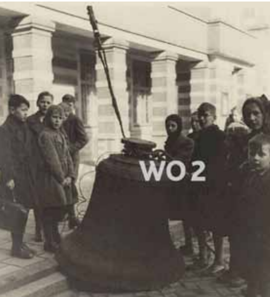
Een door de Duitsers in WO II gevorderde klok van het stadhuis collectie ELO

bloeiende handel. Het besluit om hier een tweede stadsuurwerk aan te schaffen was een unicum. Het kwam in de Lodewijkkerk, toen nog de Lakenhal.' Maar hoe voorkom je dat die twee door elkaar heen gaan spelen? 'Dan maak je een naslag. De urslagen gaan gelijk, eerst speelt het stadhuis een melodie en daarna de Lodewijk.'