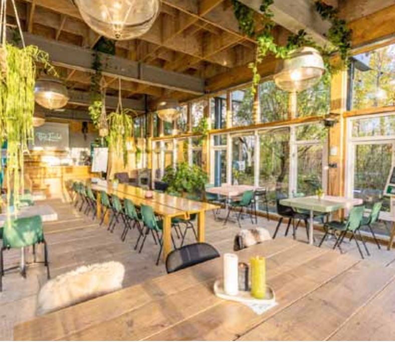
Duurzaamheidscentrum The Field, Stationsplein 25 Leiden

in de breedste zin van het woord. Als ik zelf geen antwoorden heb zal ik proberen om anderen te vinden die dat wel kunnen. (ronald@duurzaamleiden.com)