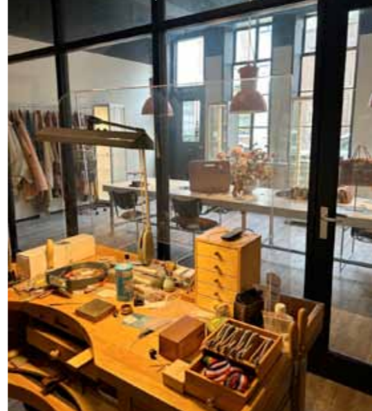
Het exclusieve Atelier de Zilverling op Langebrug 85