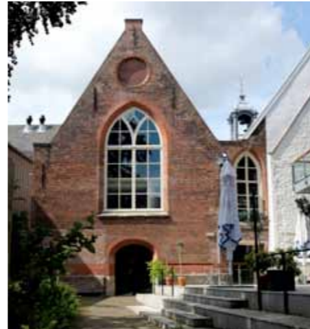
Achter de Waalse Kerk

U bent van harte welkom. (De Orgelcommissie van de Waalse Kerk Leiden)