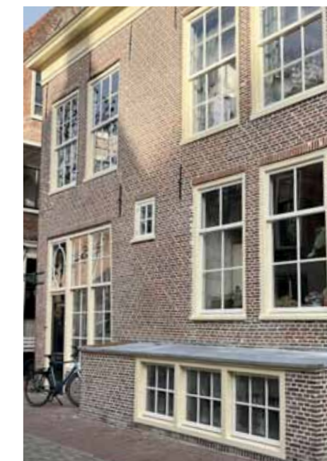
Het Pothuis, hoek Pieterskerkstraat en Diefsteeg

stichting heeft een ANBI-status, zodat de schenker bij leven het bedrag van de belasting kan aftrekken.' De erflater heeft daarmee de zekerheid dat het huis op een verantwoorde manier wordt gerestaureerd en verduurzaamd, zodat het nog jaren mee kan. Onlangs verwierf Diogenes het historische pand Lange Mare 110. Eerst zal het achterhuis worden gerestaureerd, zodat de vorige eigenaar daar kan gaan wonen. Op de benedenverdieping van het grote voorhuis was 140 jaar een apotheek gevestigd. Deze ruimte en alle overige delen zullen in volgende fases worden opgeknapt.'