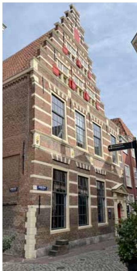
De Latijnse School in de Lokhorststraat