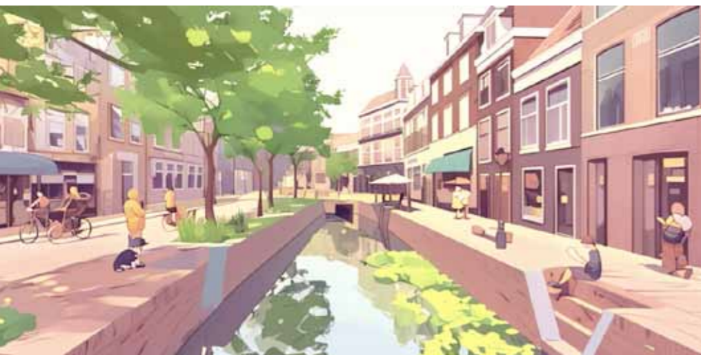
Het Kort Rapenburg als gracht impressie Gemeente Leiden