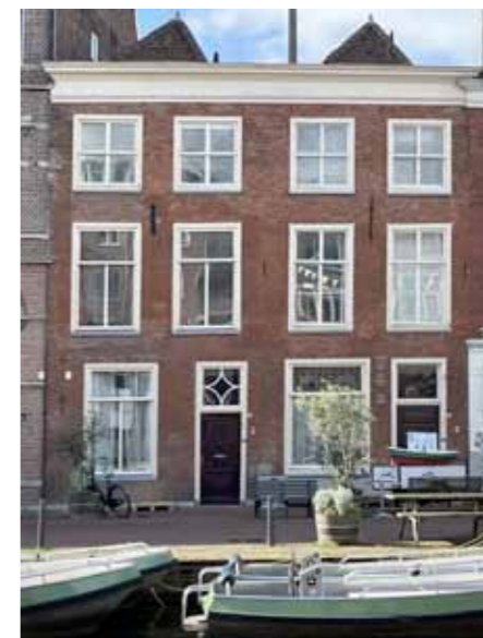
Aalmarkt 5 en 6

Wat betreft de rijksmonumenten Aalmarkt 5 en 6 constateerde Diogenes al in 1975