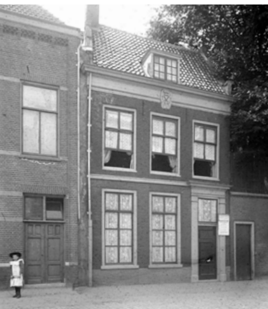
Papengracht 7 rond 1900

Wie over de Papengracht wandelt, loopt ongemerkt langs een van de oudste bouwresten van Leiden. Lange tijd werd gedacht dat het middeleeuwse Lombardenhuis, ooit gelegen aan de vroegere Kreupelsteeg, spoorloos verdwenen was. Maar recent bouwhistorisch en archeologisch onderzoek bracht verrassend bewijs aan het licht: delen van dit huis bestaan nog steeds - verstopt in muren en onder de stoep.