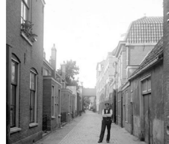
De Vestestraat rond 1900 met rechtsachter de textielfabriek van Zaalberg