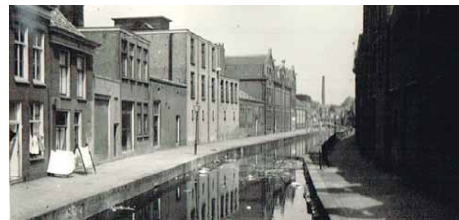
De Uiterstegracht rond 1958

*De gegevens over arm Leiden heb ik uit de prachtige reeks Leiden zoals het was (1995), deel 3.