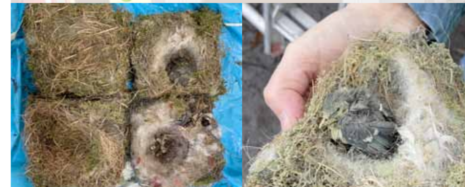
Illustratie en foto's Eduard Groen

Op de foto links van de vier gevonden nesten zijn de twee kleinere dode vogeltjes te zien. Mijn (Eduard Groen) veronderstelling is dat de linker nestjes van pimpelmezen zijn en die rechts van koolmezen. Dat is iets om nader uit te zoeken.