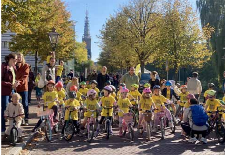
Dikkebandenrace in 2025

Hier rechts een overzicht van wat er in ons lustrumjaar nog allemaal te beleven valt. Doe mee, samen maken we er een onvergetelijk jubileumjaar van. Het programma is te vinden op www.palleiden.nl . Daar kunt u zich ook aanmelden.