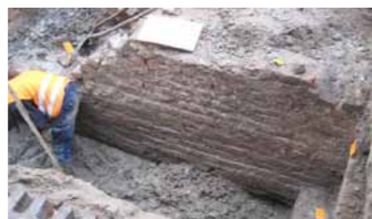
Opgraving in 2015 door RAAP

worden ze al in bronnen uit 1289 genoemd en waarschijnlijk waren ze toen al jaren hier gevestigd. Het bakstenen gebouw is opmerkelijk, want zeldzaam in die tijd. Baksteen was een kostbaar materiaal, uitsluitend gebruikt voor de belangrijkste bouwwerken - zoals de Burcht, het Gravensteen en de Commanderie van de Duitse Orde. Dat de Lombarden een stenen huis hadden, benadrukt hun aanzien en economische rol in het jonge Leiden.