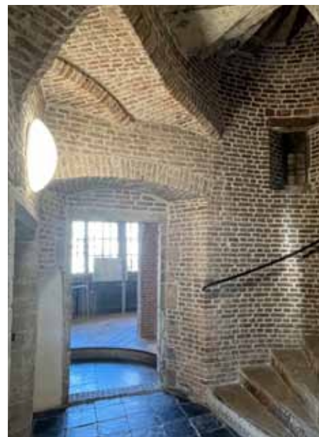
Interieur het Gravensteen

Volgens Barendsen is dat precies waar erfgoed vandaag de dag relevant wordt. Niet door vast te houden aan hoe het ooit was, maar door te laten zien hoe verandering altijd onderdeel van de stad is geweest. 'Als je naar historische groenstructuren in Leiden kijkt, zie je dat die door de eeuwen heen steeds andere functies hadden. Dat betekent dat we niet alles moeten conserveren zoals het was. Het betekent dat we moeten begrijpen