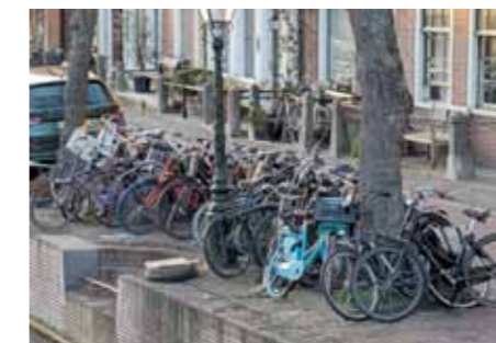
Fietsen aan nietjes langs het Rapenburg

Als het plan doorgaat komen er aan beide zijden van het Rapenburg tussen de Nonnenbrug en de Doelenbrug ruim 130 fietsparkeerplaatsen bij. Hiermee wordt dat stuk Rapenburg één grote publieke fietsenstalling. De gemeente suggereert in de onlangs verspreide bewonersbrief dat de gracht er in de nieuwe situatie op vooruit gaat. De brief toont de huidige en de nieuwe situatie. De huidige situatie laat een rijtje geparkeerde auto's zien ter hoogte van Rapenburg 52, dat het zicht belemmert op het water. Op de impressie-tekening van de nieuwe situatie zijn de geparkeerde auto's vervangen door 'fietsnietjes', waar een enkele fiets aan is vastgemaakt.