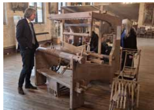
Het historische weefgetouw