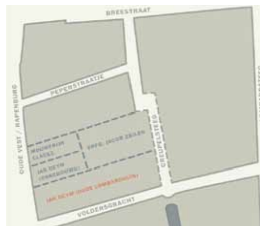
Uit: Het Rapenburg: Geschiedenis Van Een Leidse Gracht (Leiden 1987). Reconstructie naar Th.C. Lunsingh Scheurleer, Willemijn Fock & A.J. van Dissel

De Lombarden waren Italiaanse geldwisselaars en bankiers die al vroeg in de Lage Landen actief waren. In Leiden