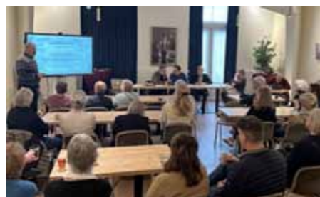
ALV 2024

De stukken voor de vergadering, zoals het verslag van de ALV 2025, het Jaarverslag 2025 (financieel en inhoudelijk) en de bevindingen van de Kascommissie, vindt u op onze website: www.palleiden.nl