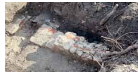
De oude stadsmuur bij de muurtoren Oostenrijk

3 van de herinrichting van kade en brug. Eind mei moet die klaar zijn. De kruising van de Jan van Houtkade en de Jacobsgracht is in die fase niet begaanbaar. Je kunt de kade van beide zijden in en uit via een keerlus. De Jan van Houtkade is van beide kanten bereikbaar. Je kunt erop en eraf af via een keerlus. (De redactie)