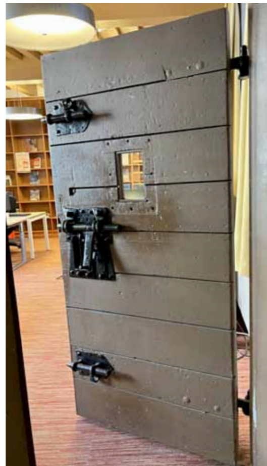
Interieur het Gravensteen

Aan het einde van het gesprek komt Barendsen terug op wat hem persoonlijk raakt. Niet de grote verhalen, maar details als de twee niet-functionerende schoorstenen op het dak van het Gravensteen - met zonnewijzers die technisch gezien eigenlijk niet kloppen maar wat slim is opgelost. 'Dat iemand daar zóveel moeite voor deed. Dat vind ik prachtig' Het is misschien wel de essentie van Barendsens visie: aandacht. Voor detail, voor context, voor verandering. Erfgoed als uitnodiging om beter te kijken. Niet om terug te verlangen naar vroeger, maar om het heden scherper te zien. 'Het verleden is niet af', zegt hij. 'We maken het telkens opnieuw. Samen.'