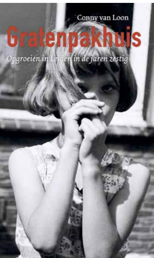
Gratenpakhuis: Opgroeien in Leiden in de jaren zestig (Primavera Pers, 269 blz.)