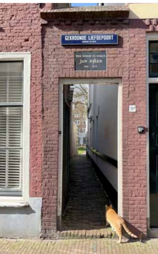
Gedenksteen boven de Gekroonde Liefdepoort, de toegang tot Langebrug 93, het 17de eeuwse huis waarnaar de poort is genoemd