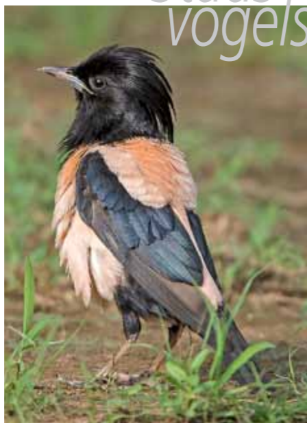
De roze spreeuw (Latijnse naam: pastor roseus )

De roze spreeuw heet zo vanwege de zachtroze veren op buik, borst en rug. Het is een steppe- en woestijnvogel die vooral in Azië leeft. De westgrens van het broedgebied ligt in Oekraïne, met uitzonderlijke uitschieters tot in Roemenië en Hongarije. De broedtijd valt samen met het seizoen voor sprinkhanen, zodat de jongen kunnen opgroeien in de tijd dat er veel sprinkhanen en andere insecten zijn. In sprinkhaanrijke jaren is het broedsucces groot en groeit de populatie. Na de korte broedperiode zwerven de roze spreeuwen rond, op zoek naar sprinkhanen, om later in de zomer hun dieet te wijzigen in graan en vruchten.