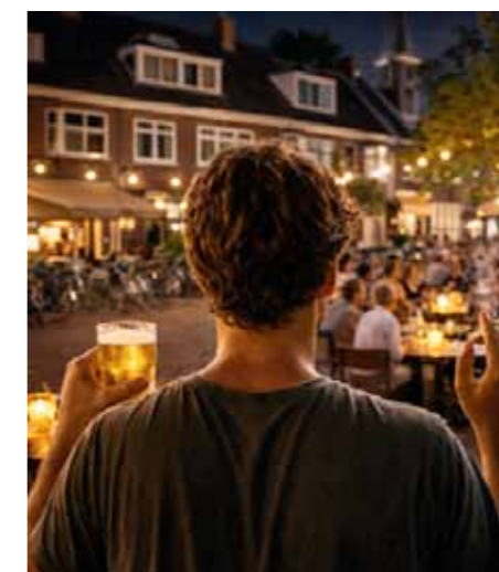
Illustratie gegenereerd door Dall-E

Sentrum: 'Ik doe wat ik kan voor jullie, maar ik moet voorzichtig zijn. Bijna iedereen in de raad wil vergroenen, dus daar kan ik niet openlijk tegenin. Straks moet mijn subsidie weer verlengd worden weet je.'